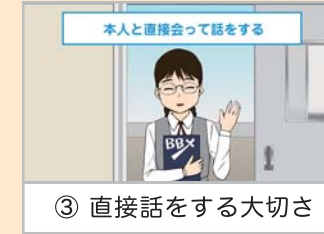
③ 直接話をする大切さ