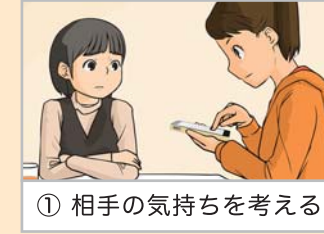
① 相手の気持ちを考える