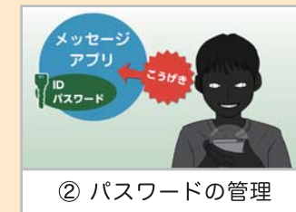
② パスワードの管理