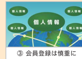
③ 会員登録は慎重に