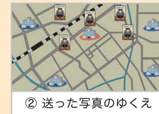
② 送った写真のゆくえ