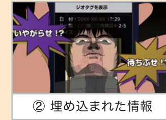
② 埋め込まれた情報