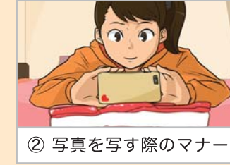
② 写真を写す際のマナー