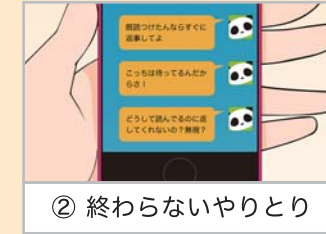
② 終わらないやりとり