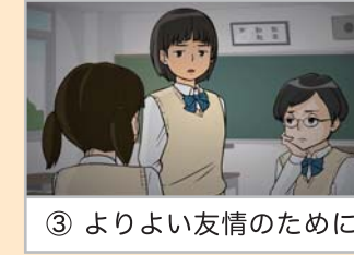
③ よりよい友情のために