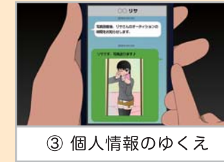
③ 個人情報のゆくえ